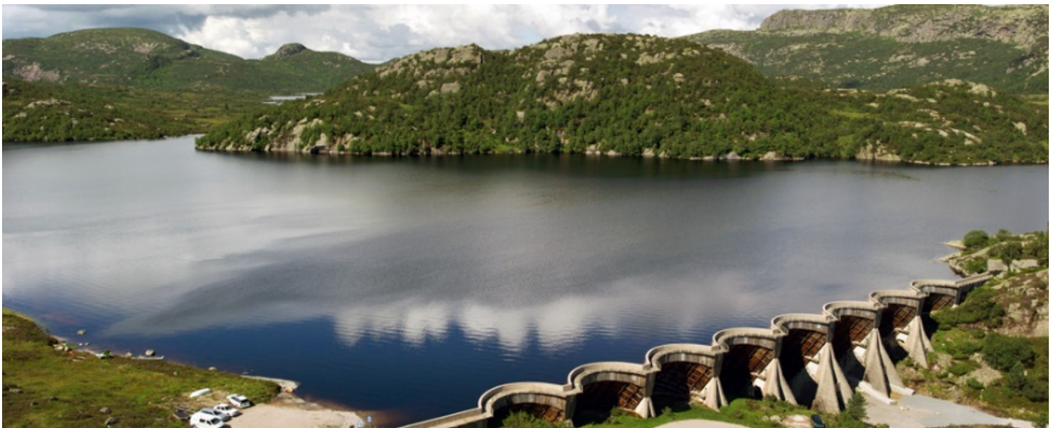
Dam Skjerka, Åseral kommune

Vedtatt representantskapet 19. juni 2015