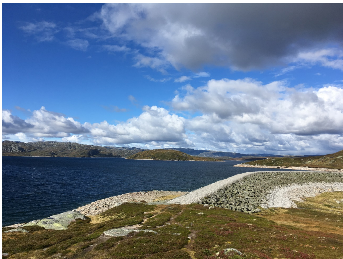
Dam Roskreppfjorden, Sirdal og Valle kommunar, september 2017