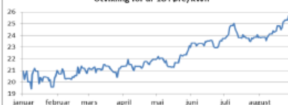
Utvikling for år 18 i øre/kWh