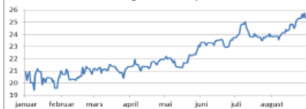
Utvikling for år 18 i øre/kWh