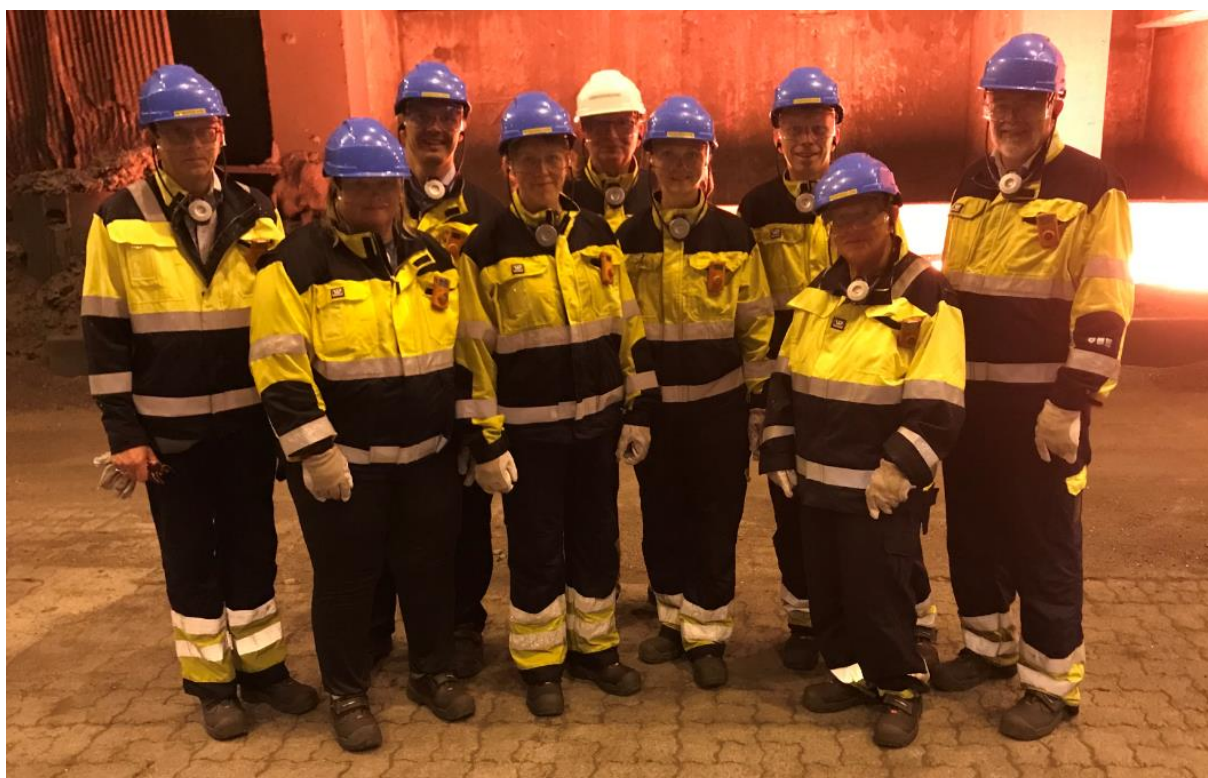
Omvising på Eramet i samband med risikoseminar i september 2018