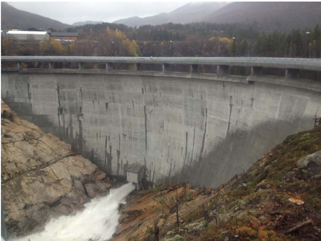
Dam Sarvsfossen, Bykle kommune, oktober 2014

Vedtatt styret 5. juni 2015 Vedtatt representantskap 19. juni 2015