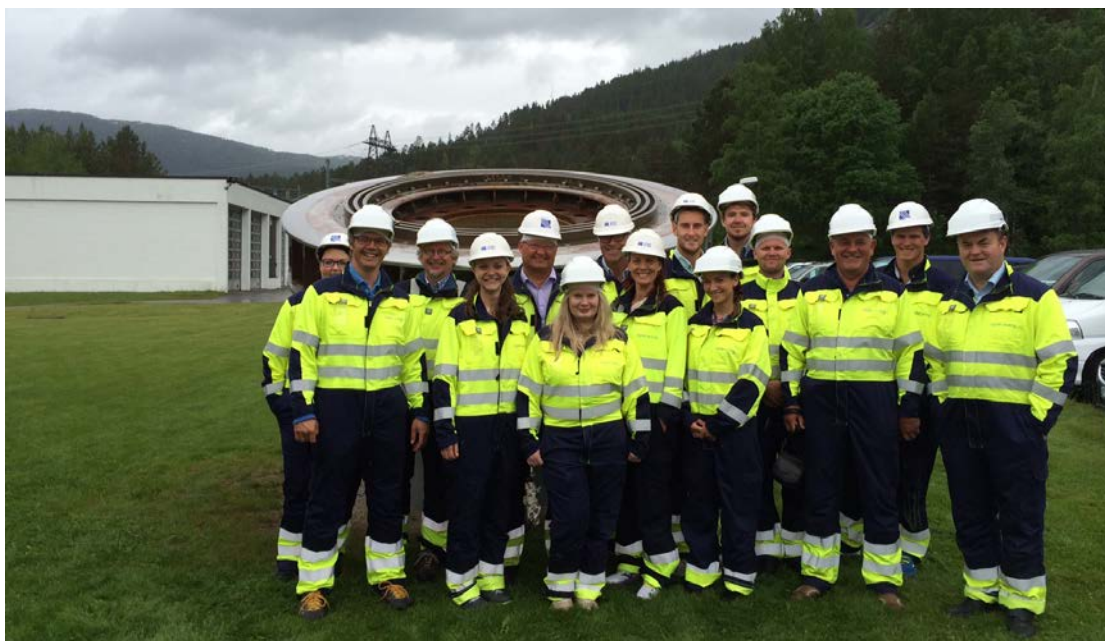
Styret på omvising på Brokke kraftstasjon, juni 2014